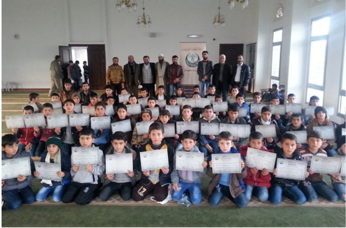
تكريم الطلاب في مخيم كيليس