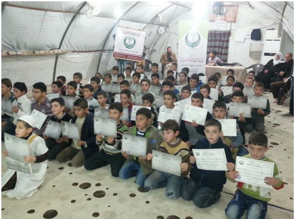
تكريم الطلاب في مخيم قرقيش