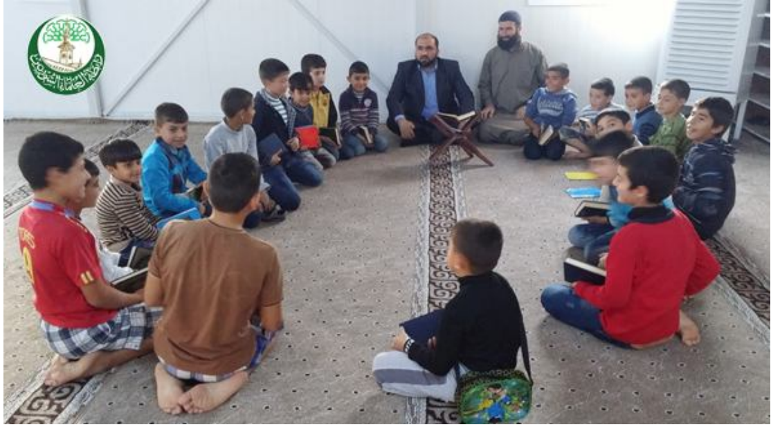
المشرف يتفقد الحلقات القرآنية في مخيم الضباط