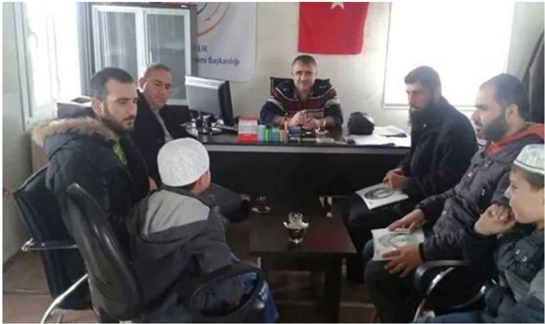
زيارة مشرفي مخيم جيلان بينار مع بعض الطلاب لمدير المخيم وشكره على جهوده في خدمة السوريين