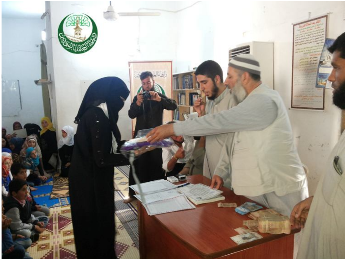
تكريم الطالبات المتميزات في إحدى حفلات التكريم في حماة