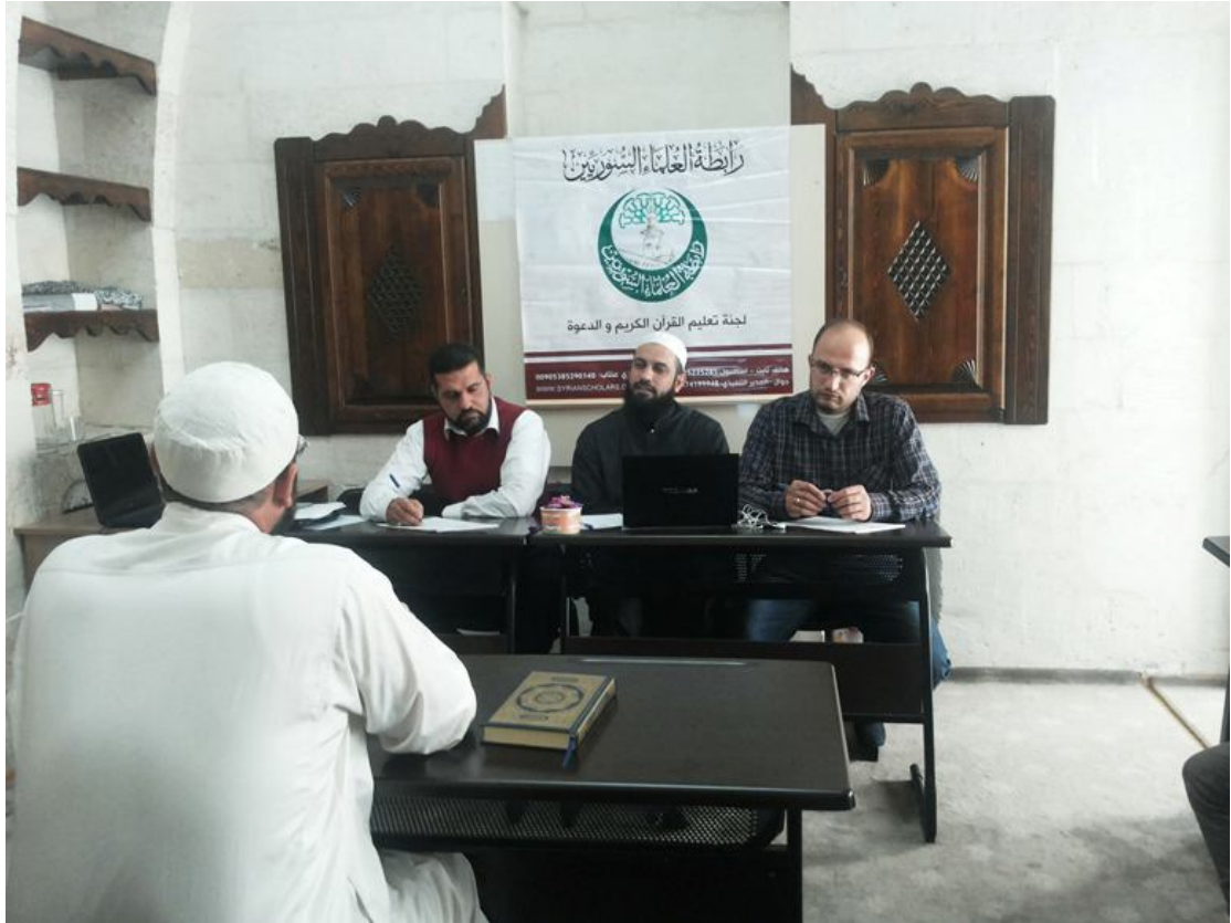
لجنة مقابلة المرشحين للإشراف في مخيمات أورفا مع أحد المعلمين