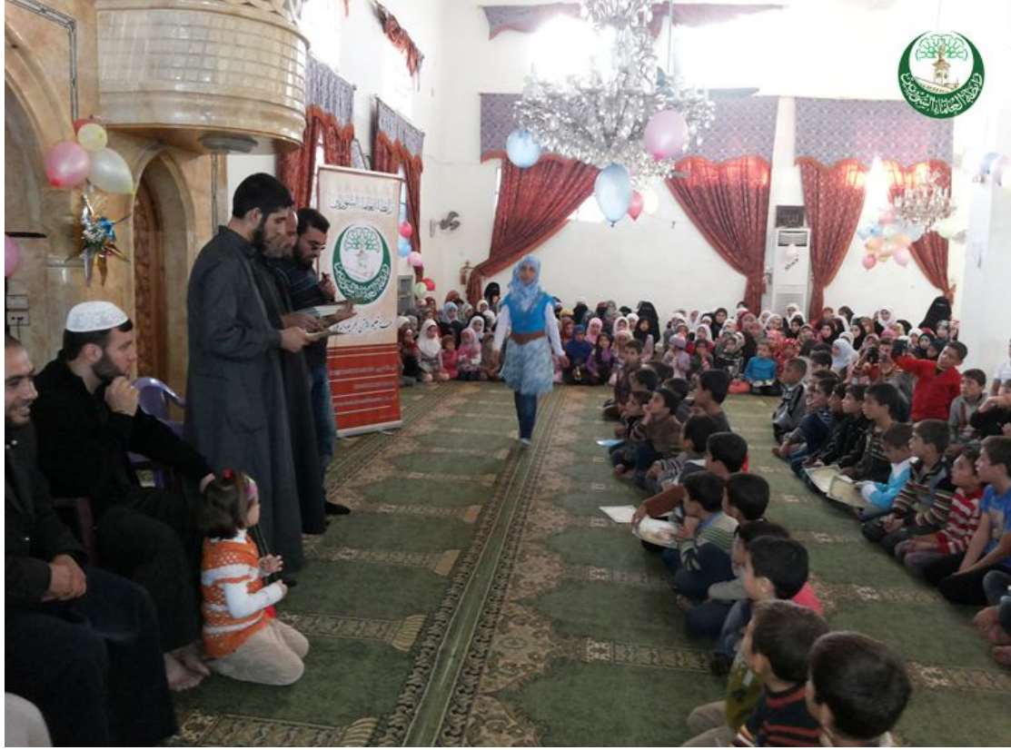
حفل تكريم عشرات الطلاب حيث ازدان مكان الحفل بالزينة ابتهاجاً بتكريم الطلاب