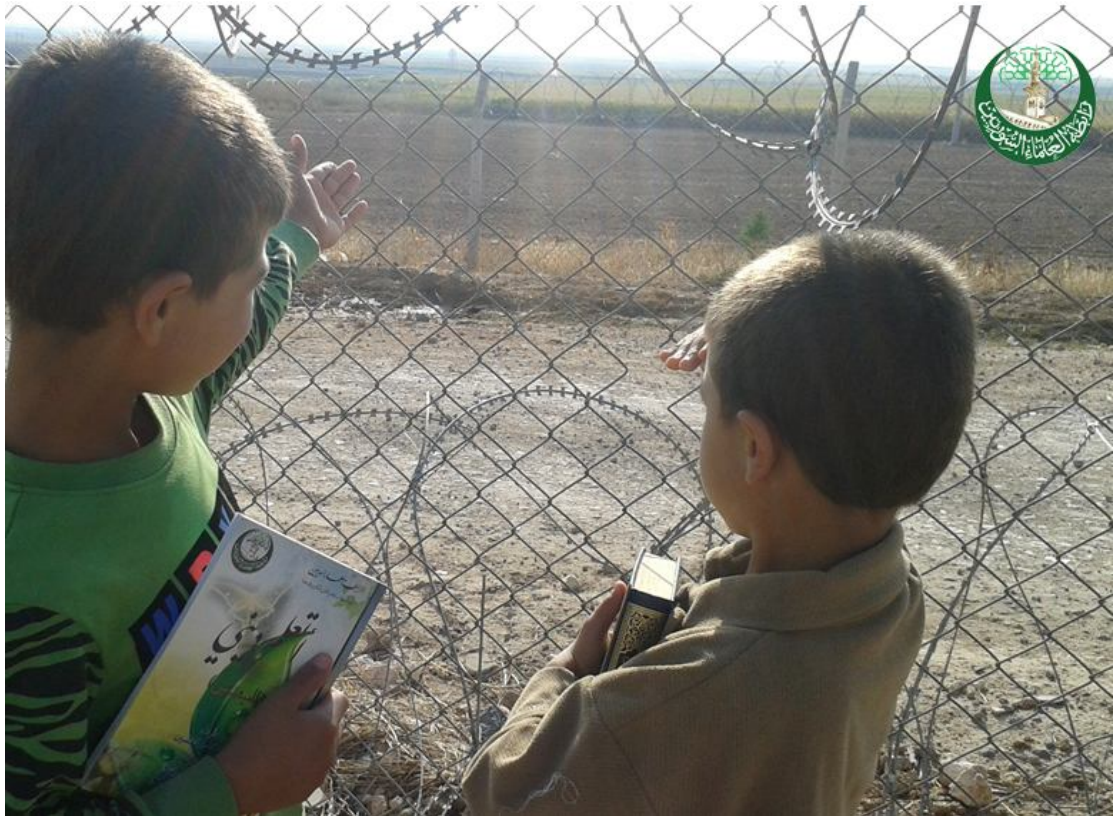
وطني: سأرجع إليك، والقرآن في قلبي، وبالعلم سأبني أرضك مهما طال الزمن