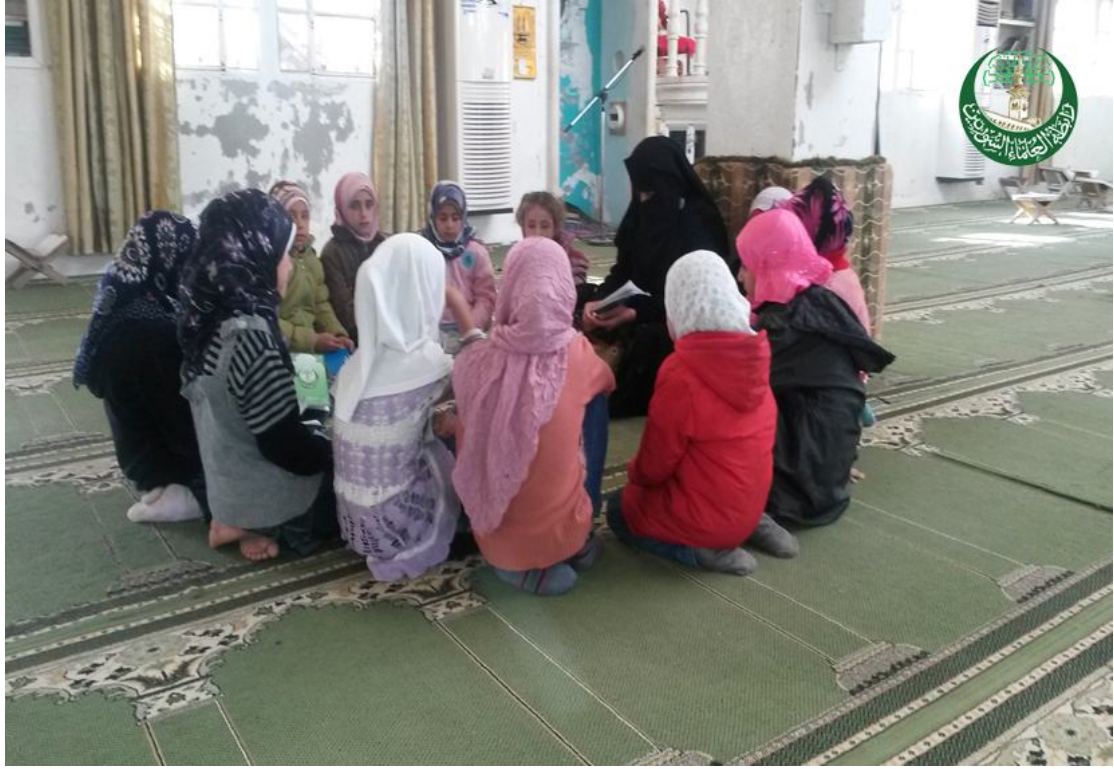
من حلقات الرابطة لتحفيظ القرآن الكريم في ريف المعرة