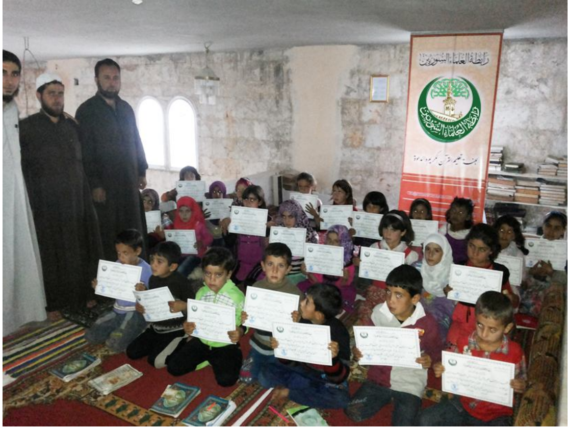
تخريج العشرات من الطلاب الذين أتموا الجزء الرشيدي