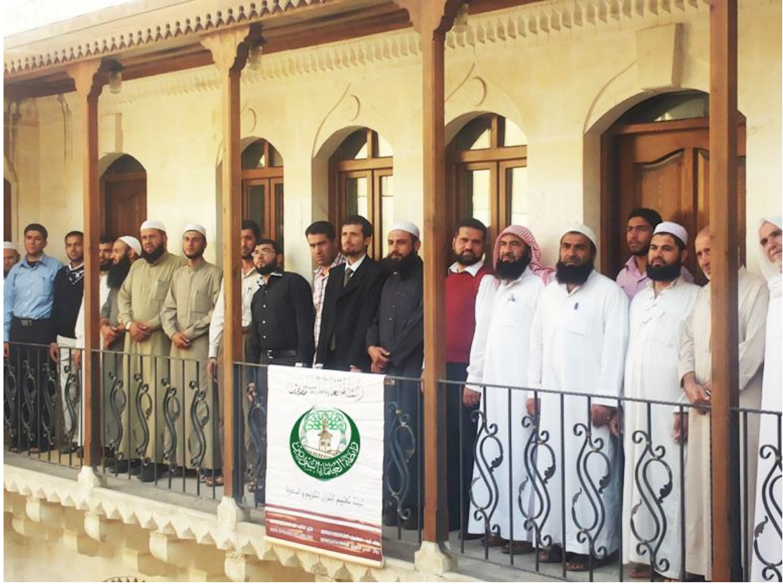
المرشحون للإشراف في مخيمات أرفا مع لجنة المقابلة