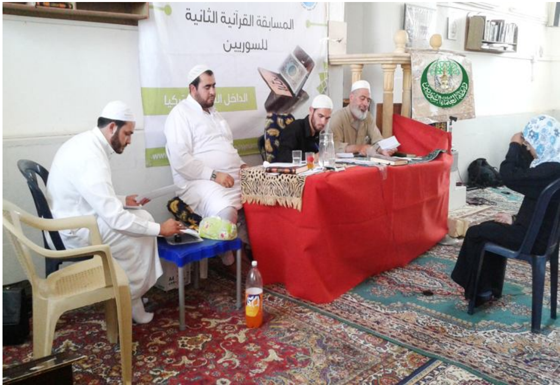
المسابقة القرآنية الثانية - ريف إدلب