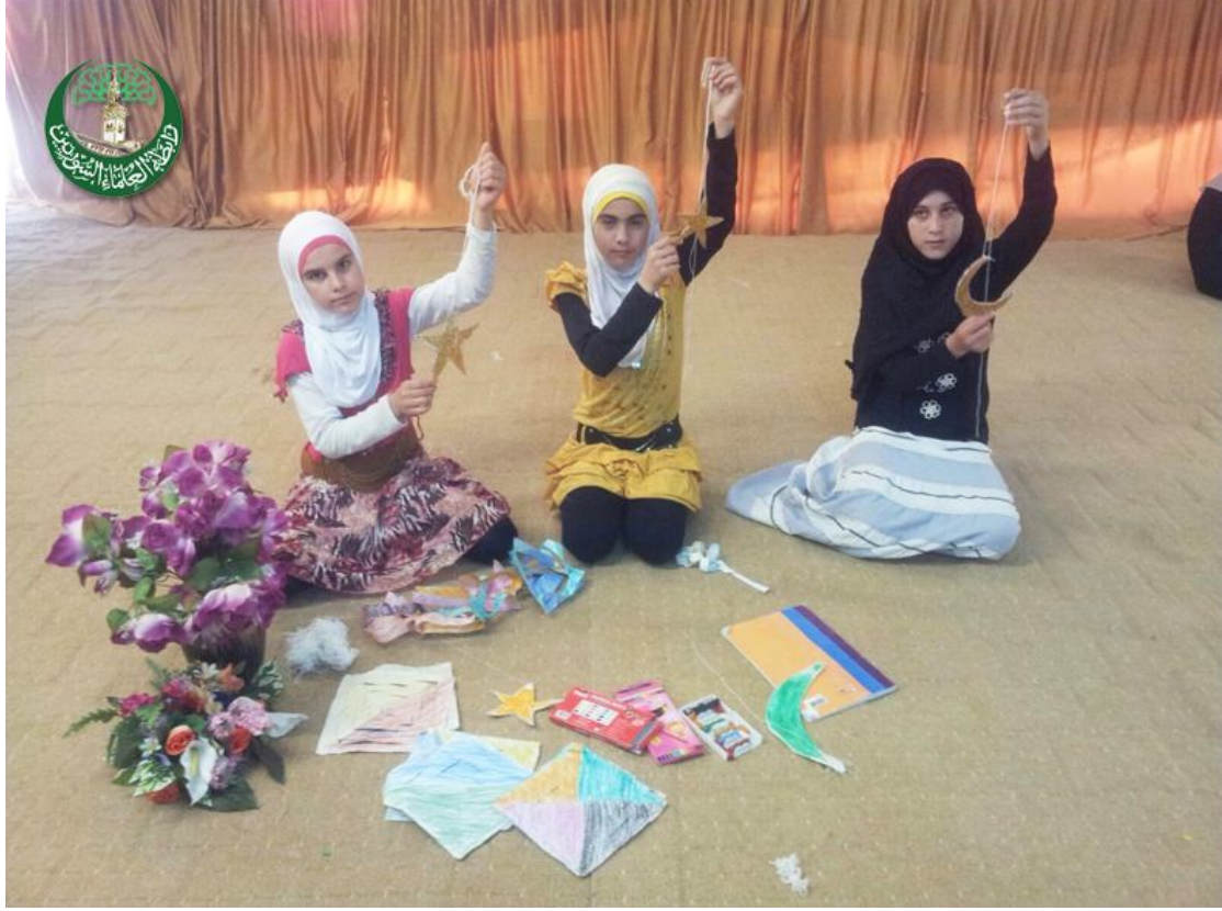
بعض الأنشطة الطلابية صنع الأشكال الرسومية - تل أبيض