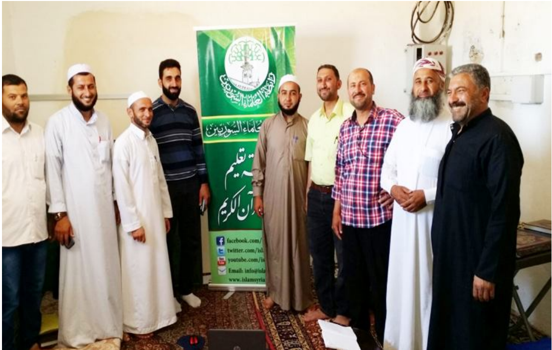
الاجتماع الدوري الأسبوعي لمشرفي ريف حلب الغربي والجنوبي