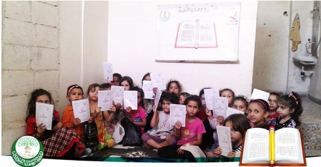
حلقات محو الأمية في ريف حمص ( الرستن)