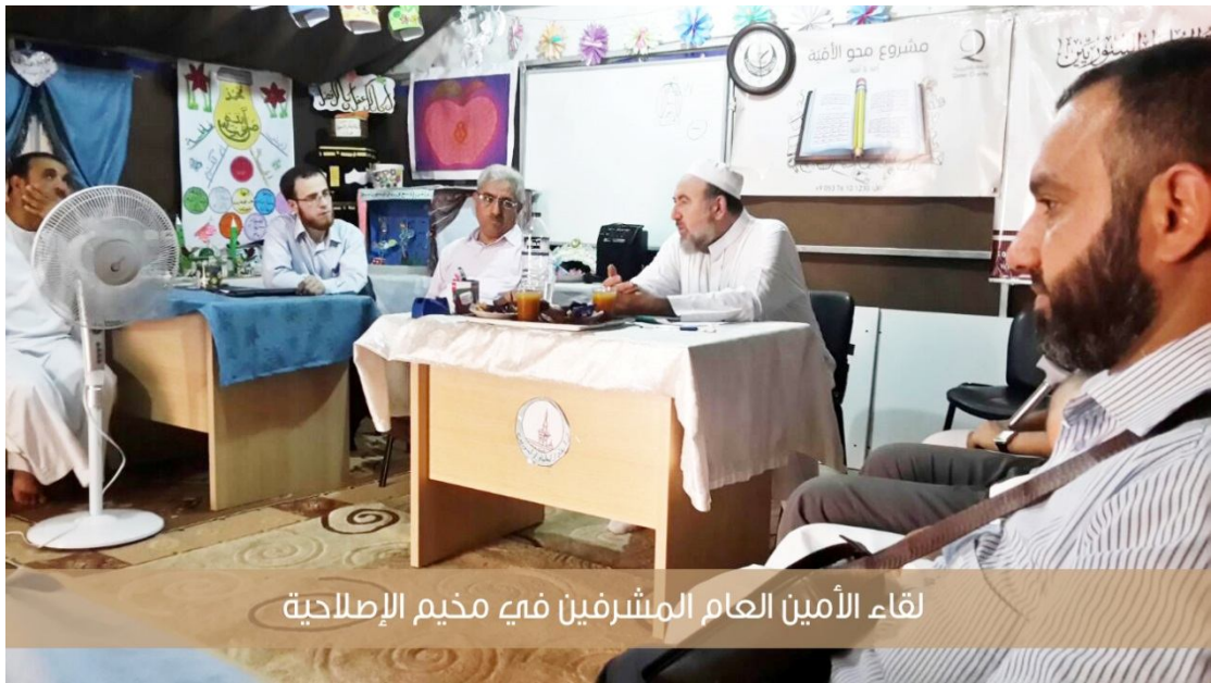
لقاء الأمين العام المشرفين في مخيم الإصلاحية