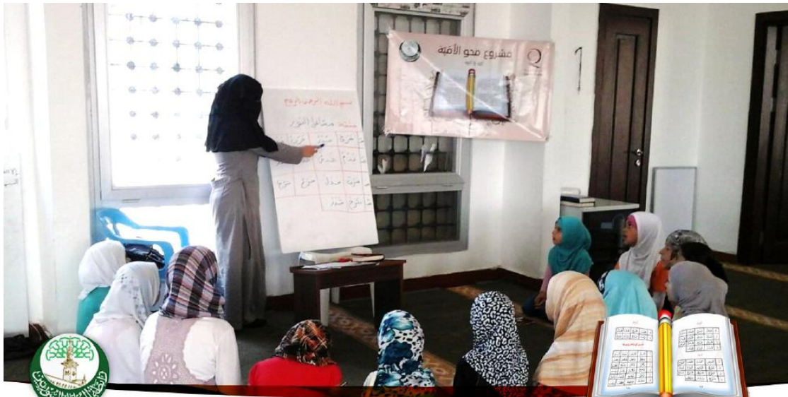
مشروع محو الأمية