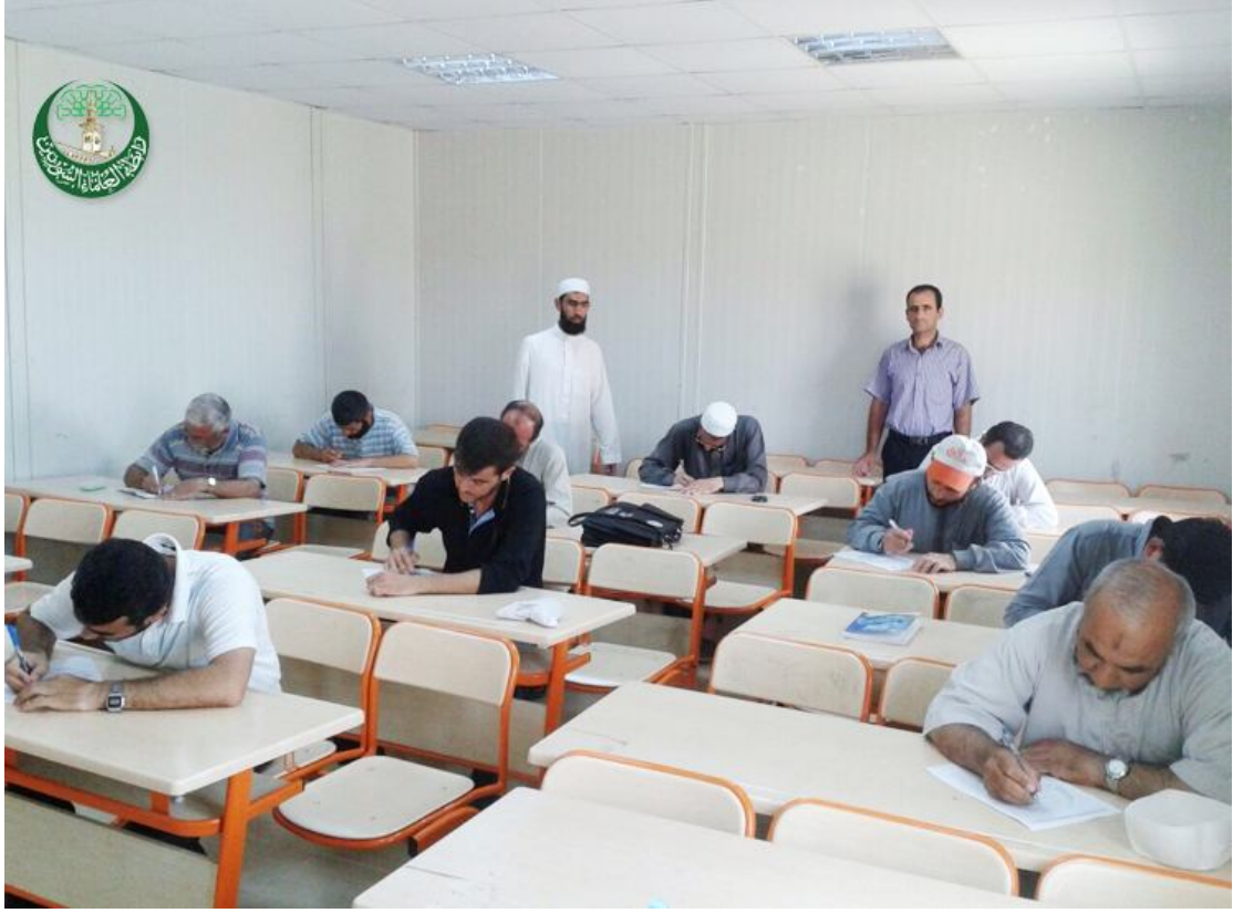
اختبار المتقدمين لتدريس القرآن الكريم والرشيدي في مادة أتعلم ديني في أديمن