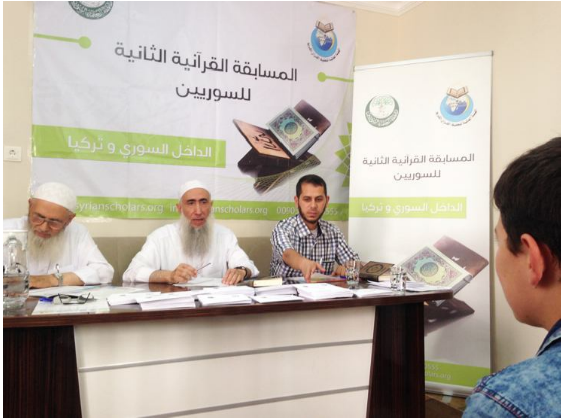
المسابقة القرآنية الثانية - أورفا