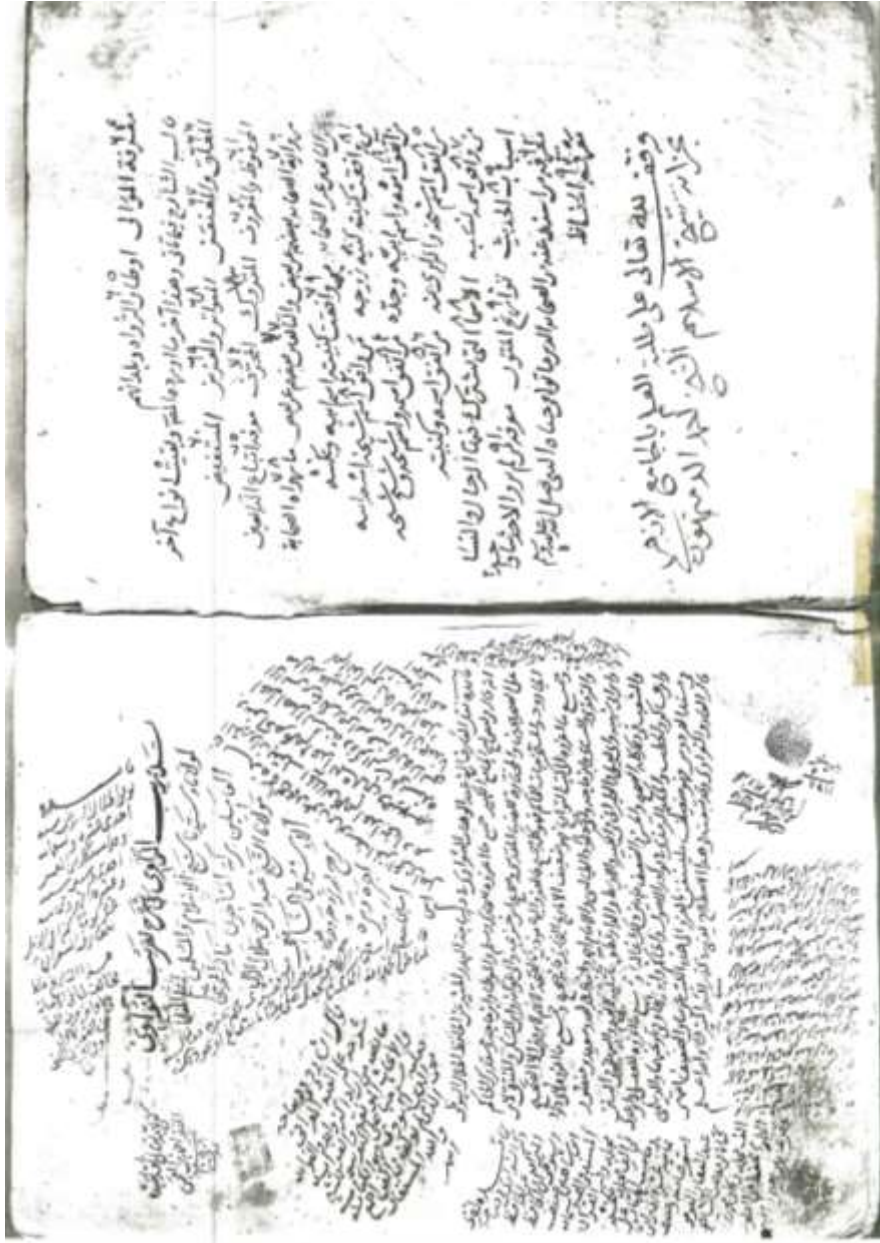
صفحة العنوان من النسخة الأزهرية (أ)