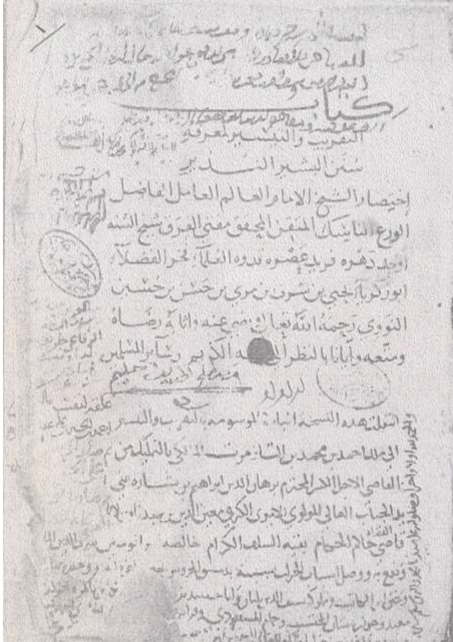
ورقة العنوان من نسخة دار الكتب والوثائق القومية أ